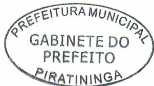
CARLOS ALESSANDRO FRANCO BORRO DE MATOS Prefeito Municipal

Registrada na Secretaria Municipal e Publicada no Quadro de Avisos do Paço Municipal nesta data, em conformidade com o que dispõe o Artigo 69 da Lei Orgânica do Município de Piratininga.