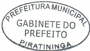
CARLOS ALESSANDRO FRANCO BORRO DE MATOS Prefeito Municipal

Registrada na Secretaria Municipal e Publicada no Quadro de Avisos do Paço Municipal nesta data, em conformidade com o que dispõe o Artigo 69 da Lei Orgânica do Município de Piratininga.