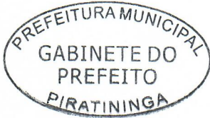
CARLOS ALESSANDRO FRANCO BORRO DE MATOS Prefeito Municipal

Registrada na Secretaria Municipal e Publicada no Quadro de Avisos do Paço Municipal nesta data, em conformidade com o que dispõe o Artigo 69 da Lei Orgânica do Município de Piratininga.