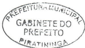
JORGE LUIS DIAS Prefeito Municipal

Arquivada no Setor de Protocolo, Arquivo e Atendimento Municipal; Afixada no Quadro de Avisos do Paço Municipal e Publicada no site e no Diário Oficial do Município, em conformidade com a Lei Orgânica do Município de Piratininga.