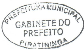
JORGE LUIS DIAS Prefeito Municipal

Arquivado no Setor de Protocolo, Arquivo e Atendimento Municipal; Afixado no Quadro de Avisos do Paço Municipal e Publicado no site e no Diário Oficial do Município, em conformidade com a Lei Orgânica do Município de Piratininga.