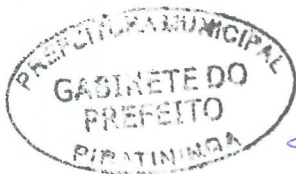
JORGE LUIS DIAS Prefeito Municipal

Arquivada no Setor de Protocolo, Arquivo e Atendimento Municipal; Afixada no Quadro de Avisos do Paço Municipal e Publicado no site e no Diário Oficial do Município, em conformidade com a Lei Orgânica do Município de Piratininga.