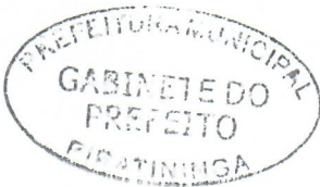
JORGE LUIS DIAS Prefeito Municipal

Arquivada no Setor de Protocolo, Arquivo e Atendimento Municipal; Afixada no Quadro de Avisos do Paço Municipal e Publicada no site e no Diário Oficial do Município, em conformidade com a Lei Orgânica do Município de Piratininga.