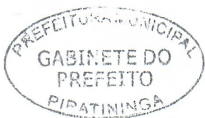
JORGE LUIS DIAS Prefeito Municipal

Arquivado no Setor de Protocolo, Arquivo e Atendimento Municipal; Afixado no Quadro de Avisos do Paço Municipal e Publicado no site e no Diário Oficial do Município, em conformidade com a Lei Orgânica do Município de Piratininga.