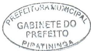
JORGÉ LUIS DIAS Prefeito Municipal

Art. 5º Esta Lei entra em vigor na data de sua publicação. Piratininga, 27 de Fevereiro de 2024.