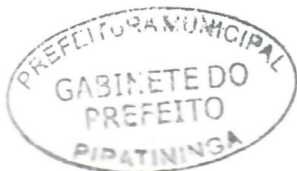
JORGE LUIS DIAS Prefeito Municipal

Arquivada no Setor de Protocolo, Arquivo e Atendimento Municipal; Afixada no Quadro de Avisos do Paço Municipal e Publicada no site e no Diário Oficial do Município, em conformidade com a Lei Orgânica do Município de Piratininga.