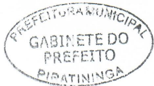
JORGE LUIS DIAS Prefeito Municipal

Arquivada no Setor de Protocolo, Arquivo e Atendimento Municipal; Afixada no Quadro de Avisos do Paço Municipal e Publicada no site e no Diário Oficial do Município, em conformidade com a Lei Orgânica do Município de Piratininga.