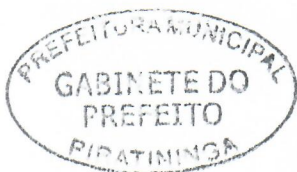
JORGE LUIS DIAS Prefeito Municipal

Arquivada no Setor de Protocolo, Arquivo e Atendimento Municipal; Afixada no Quadro de Avisos do Paço Municipal e Publicada no site e no Diário Oficial do Município, em conformidade com a Lei Orgânica do Município de Piratininga.