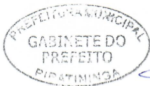
JORGE LUIS DIAS Prefeito Municipal

Arquivada no Setor de Protocolo, Arquivo e Atendimento Municipal; Afixada no Quadro de Avisos do Paço Municipal e Publicada no site e no Diário Oficial do Município, em conformidade com a Lei Orgânica do Município de Piratininga.