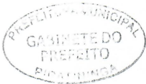
JORGE LUIS DIAS Prefeito Municipal

Arquivada no Setor de Protocolo, Arquivo e Atendimento Municipal; Afixada no Quadro de Avisos do Paço Municipal e Publicado no site e no Diário Oficial do Município, em conformidade com a Lei Orgânica do Município de Piratininga.