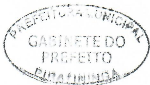
JORGE LUIS DIAS Prefeito Municipal

Arquivada no Setor de Protocolo, Arquivo e Atendimento Municipal; Afixada no Quadro de Avisos do Paço Municipal e Publicada no site e no Diário Oficial do Município, em conformidade com a Lei Orgânica do Município de Piratininga.