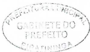
JORGE LUIS DIAS Prefeito Municipal

Arquivada no Setor de Protocolo, Arquivo e Atendimento Municipal; Afixada no Quadro de Avisos do Paço Municipal e Publicada no site e no Diário Oficial do Município, em conformidade com a Lei Orgânica do Município de Piratininga.