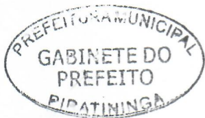
JORGE LUIS DIAS Prefeito Municipal

Arquivada no Setor de Protocolo, Arquivo e Atendimento Municipal; Afixada no Quadro de Avisos do Paço Municipal e Publicada no site e no Diário Oficial do Município, em conformidade com a Lei Orgânica do Município de Piratininga.