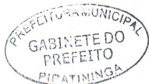
JORGE LUIS DIAS Prefeito Municipal

Arquivada no Setor de Protocolo, Arquivo e Atendimento Municipal; Afixada no Quadro de Avisos do Paço Municipal e Publicada no site e no Diário Oficial do Município, em conformidade com a Lei Orgânica do Município de Piratininga.