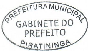
CARLOS ALESSANDRO FRANCO BORRO DE MATOS Prefeito Municipal

Registrada na Secretaria Municipal e Publicada no Quadro de Avisos do Paço Municipal nesta data, em conformidade com o que dispõe o Artigo 69 da Lei Orgânica do Município de Piratiningá.