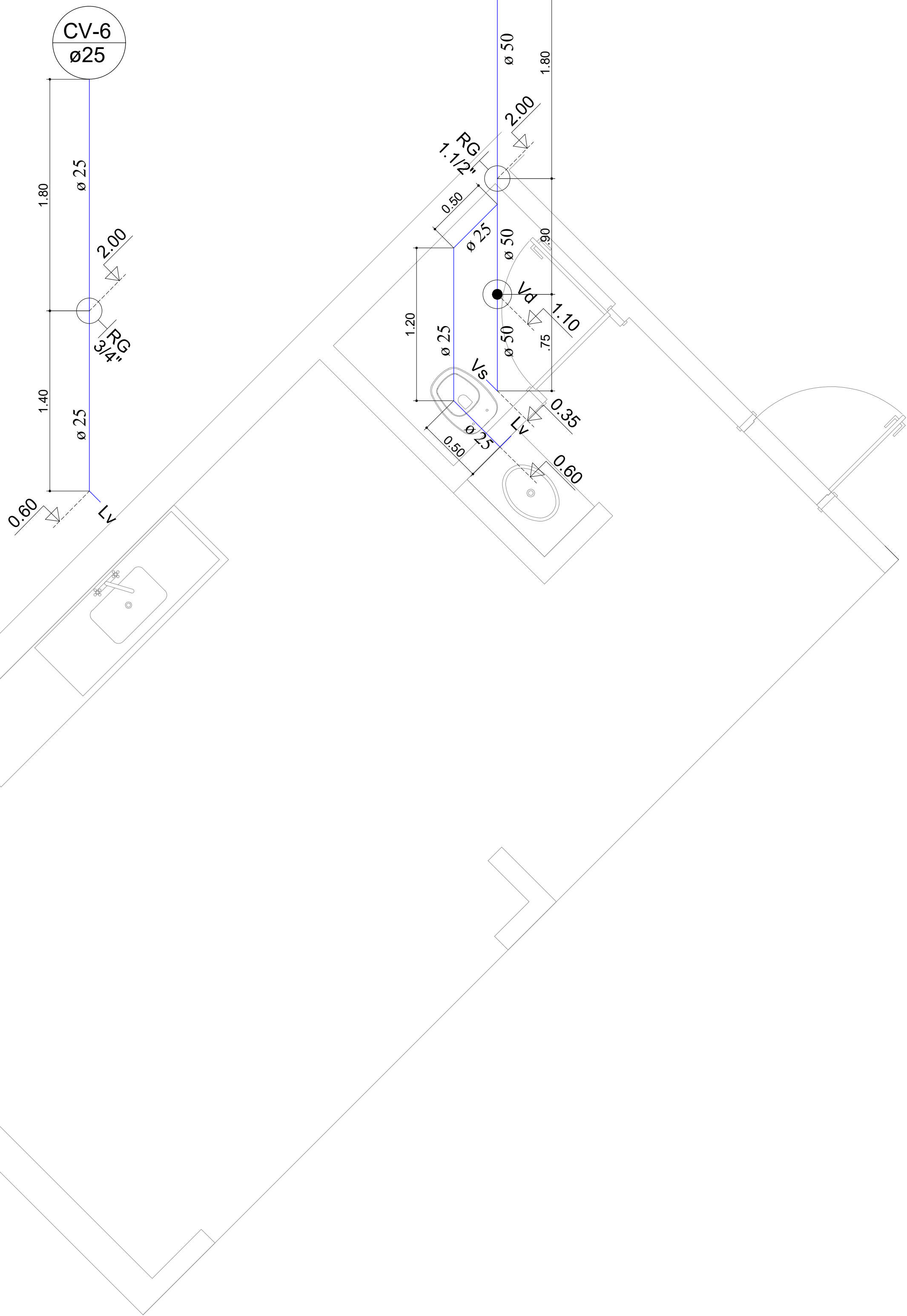
ISOMÉTRICO - COZINHA